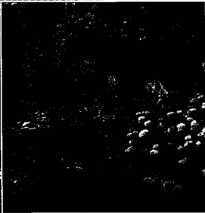
Sommerblumen im Überblick . . . . . 9