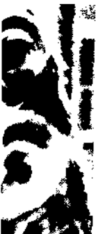
ktor Hobi er Basler such eines