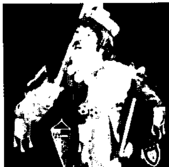
Ständerat Carl Miville Preistrommeln, Preispeifen, Monstre- Trommelkonzert 195