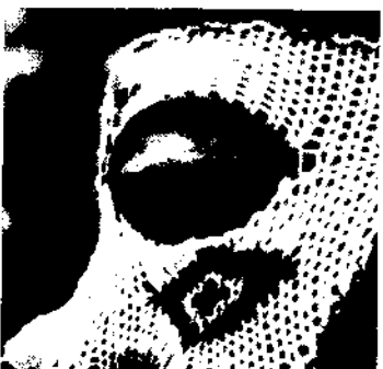
Dr. phil. Rudolf Suter Die Basler Fasnacht im Wandel 389