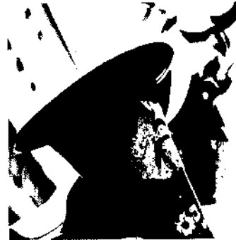
Armin Faes Wagen, Chaisen, Guggen 215