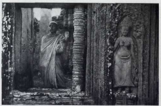
Sakrale Stätte seit 800 Jahren: der Bayontempel in Angkor..50

Die Jugend will vorwärts: Rush-hour in Saigon..... 36