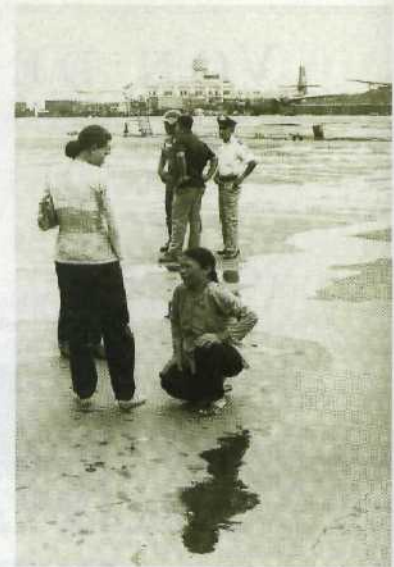
Kriegsleid: Bittere Trennung ..... 46