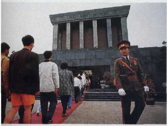
Heldenkult: das Ho-Chi-Minh-Mausoleum.....78