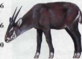
Eine neue Tierart: Waldoryx-Antilope ..... 96