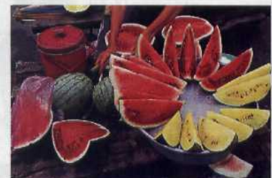
Reichtum der Armut: das Essen ..... 66