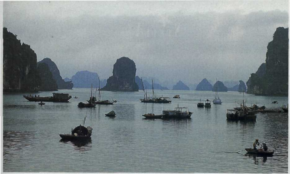
Phantastische See-Landschaft aus Abertausenden Inseln: die Ha-Long-Bucht vor Hai Phong..... 16