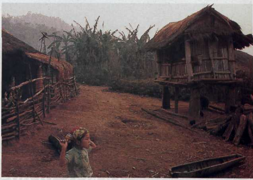
Wo die Zeit stillsteht: Dorf in Xieng Khouang, Laos..... 102