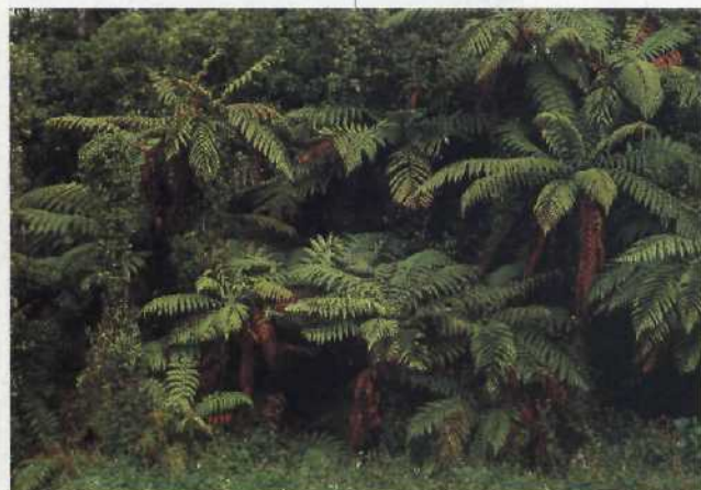
Baumfarne gedeihen prächtig an der regenreichen Westküste auf der Südinsel ..... 84

Schafscherer im Einsatz: Jährlich müssen rund 50 Millionen Schafe ihre Wolle lassen ..... 36