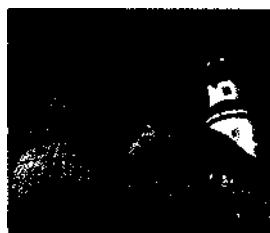
Barock mal anders in Nové Město ▶ 197