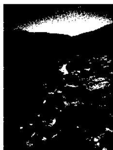
Aussichtreich: Riesengebirge ▶ 261