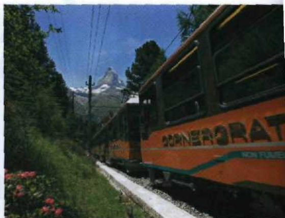
Mit der Gornergratbahn in Richtung Matterhorn