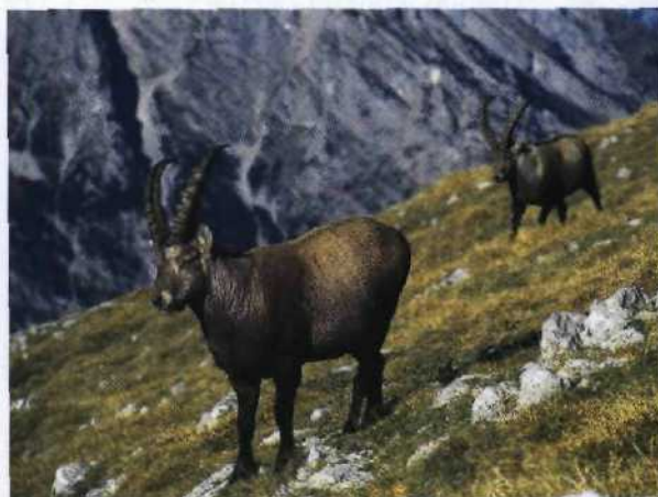
Im Nationalpark Berchtesgaden lassen sich mit etwas Glück Steinböcke beobachten