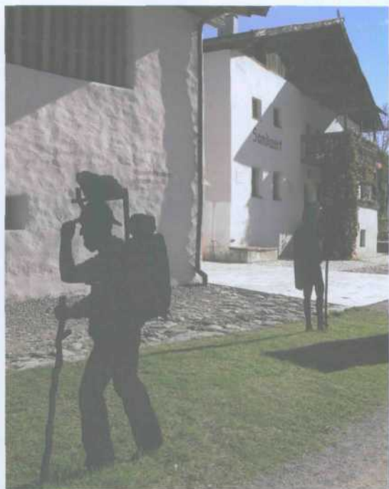
Das Andreas-Hofer-Museum am Ausgangspunkt des gleichnamigen Gedenkweges im Südtiroler Passeiertal (Tour 18)