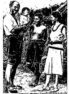
The Winner Family

DRAMA UNTER PALMEN: Vom Ende eines Traums auf einer fernen Pazifikinsel