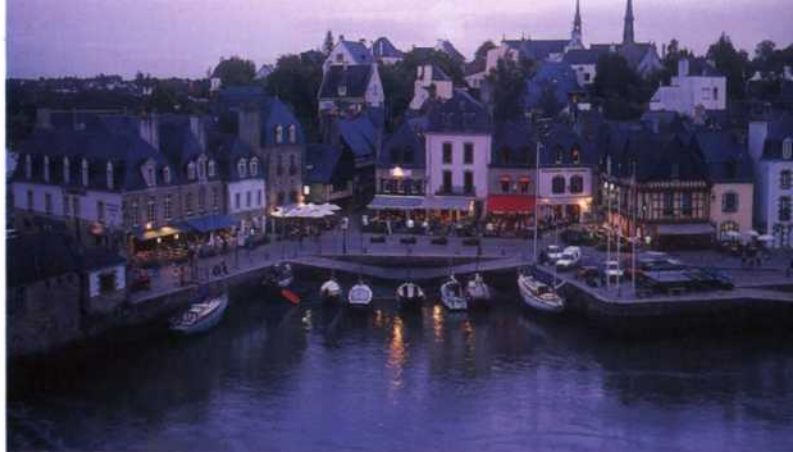
Der stimmungsvolle Hafen von Auray