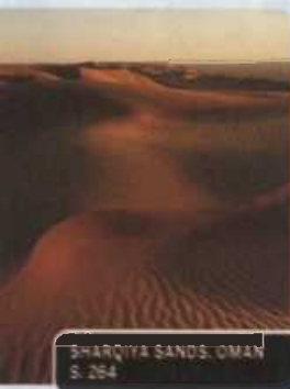
SHARQIYA SANDS, OMAN S. 294