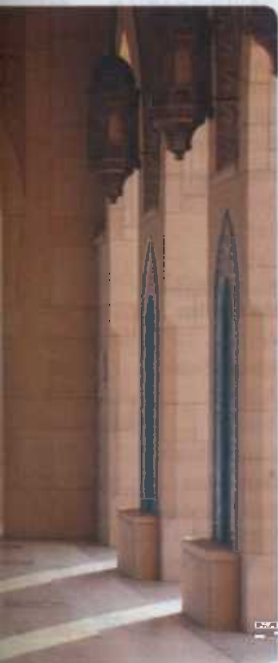
GROSSE MOSCHEE MASKAT, OMAN S. 235