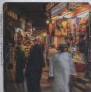
MUTRAH SOUQ, OMAN S. 382