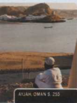
AYJAH, OMAN S. 295