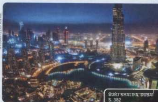
BURJ KHALIFA, DUBAI S. 382