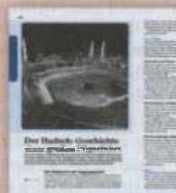
Der Hadsch: Geschichte einer großen Pilgerfahrt