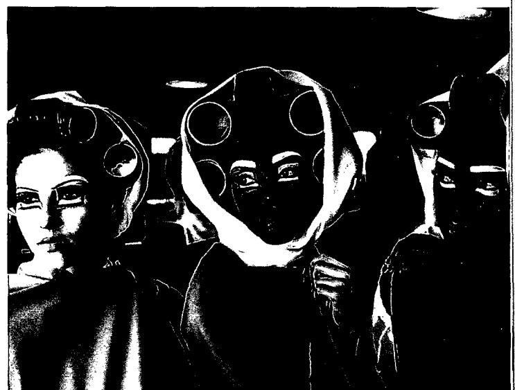
62 SÜDAFRIKAS NEUE KLEIDER: Wie Mode die Nation formt