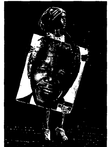
98 MANDELAS ERBEN: Südafrikas Held und die Jugend von heute

REDAKTIONSSCHLUSS: 10. NOVEMBER 2014