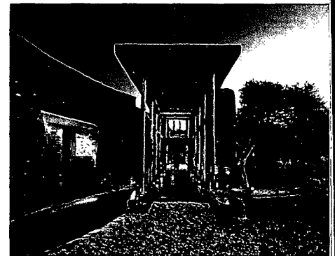
78 WILDNIS MIT KOMFORT: Die schönsten Lodges im Nirgendwo