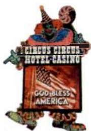
Lucky the Clown vor dem Circus Circus (siehe S. 66f)