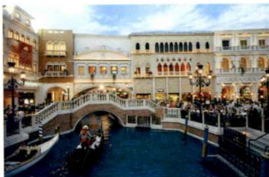
Kanal mit Gondel im luxuriösen Venetian (siehe S. 60f)