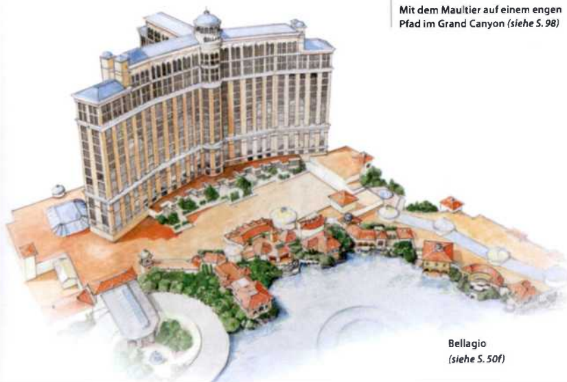
Bellagio (siehe S. 50f)