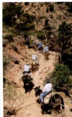
Mit dem Maultier auf einem engen Pfad im Grand Canyon (siehe S. 98)

Öffentlicher Nahverkehr Hintere Umschlaginnenseiten