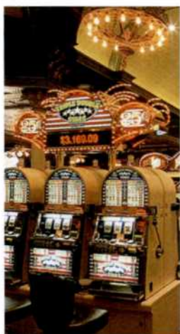
Spielautomaten, Fremont Street Experience (siehe S. 74f)