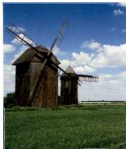
Alte Windmühlen in Wielkopolska (siehe S. 213)