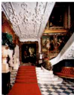
Bildergalerie und Weiße Treppe im Kozłówka-Palast (siehe S. 128)