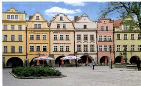
Arkadenhäuser am Marktplatz von Jelenia Góra (siehe S. 190)