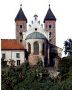
Zweitürmige Basilika in Czerwińsk an der Weichsel (siehe S. 120)