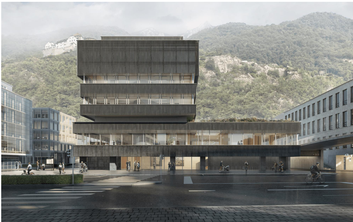
Ansicht der «Neuen Liechtensteinischen Landesbibliothek» von der Marktplatzgarage Vaduz.

Der Landtag lehnte im Juni 2024 diesen Antrag auf eine Finanzierung in Höhe von CHF 5.43 Mio. sowie die Aufstockung der Bauherrenreserve um CHF 2.14 Mio. ab. Die Abstimmung ergab lediglich sieben Ja-Stimmen. Einem während der Landtagssitzung eingereichter Gegenantrag erreichte ebenfalls lediglich acht Stimmen. Dies führte dazu, dass trotz breiter Zustimmung zum eigentlichen Wunsch einer neuen Landesbibliothek, dass vorliegende Projekt am neuen Standort vor grossen Unsicherheiten stand.