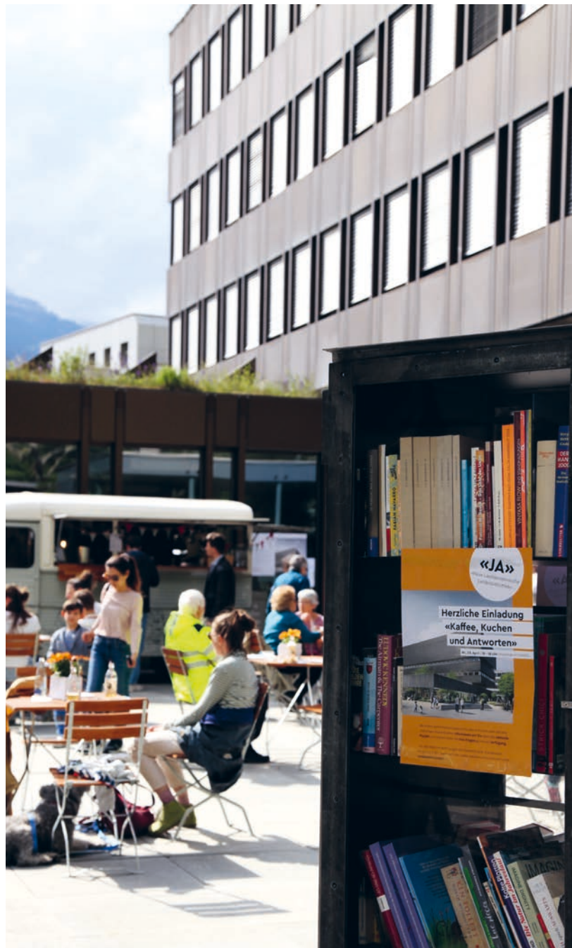
Beim Postgebäude fanden zwei Veranstaltungen statt. Dabei konnten sich Interessierte ein Bild davon machen, welche Veranstaltungsformate künftig im Aussenbereich realisiert werden können.

Die Landesbibliothek ist Mitglied von Bibliosuisse, der Dachorganisation aller Institutionen der Informations- und Dokumentationsbranche in der Schweiz und in Liechtenstein. Bibliosuisse vertritt die Branche und fördert den Berufsstand. Die Aktivitäten sind vielfältig: Sie setzt sich für die Sicherung und Stärkung der Berufsbildung ein, koordiniert die Entwicklung notwendiger Normen, Standards und Instrumente und vertritt die Grundwerte des Berufsstands.