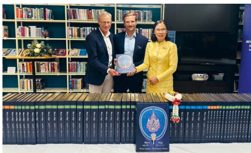
Übergabe der 80-bändigen Tipitaka-Sammlung der thailändischen Botschaft als Geschenk an das Land Liechtenstein

Im Jahr 2025 wurde ein umfangreiches Update der Goobi-Umgebung durchgeführt: Die Server wurden auf neue Versionen migriert, darunter Tomcat 10 und Java 21. Parallel dazu waren zahlreiche KI-Bots auf eLiechtensteinia aktiv, was zeitweise zu technischen Einschränkungen führte. Dank kurzfristig installierter und hochwirksamer Schutzsoftware konnten diese Angriffe erfolgreich abgewehrt werden. In der Folge sank zwar die Zahl der Besuche, die Anzahl der aufgerufenen Seiten blieb jedoch weiterhin konstant. Weiter wurde an einer Lösung für die Datumssuche gearbeitet. Nach der Evaluation wurde das Vorgehen festgelegt und eine Testumgebung erstellt. Die vollständige Umsetzung der Lösung ist bis Frühjahr 2026 geplant.