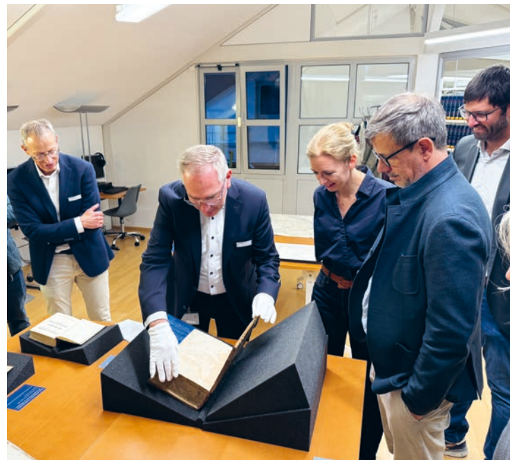
Präsentation des ältesten Buchs der Landesbibliothek an der ORF-Langen Nacht der Museen

Aufgrund ihrer jahrzehntelangen Sammeltätigkeit verfügt die Landesbibliothek über einen Bestand von rund 153'000 liechtensteinischen Publikationen.