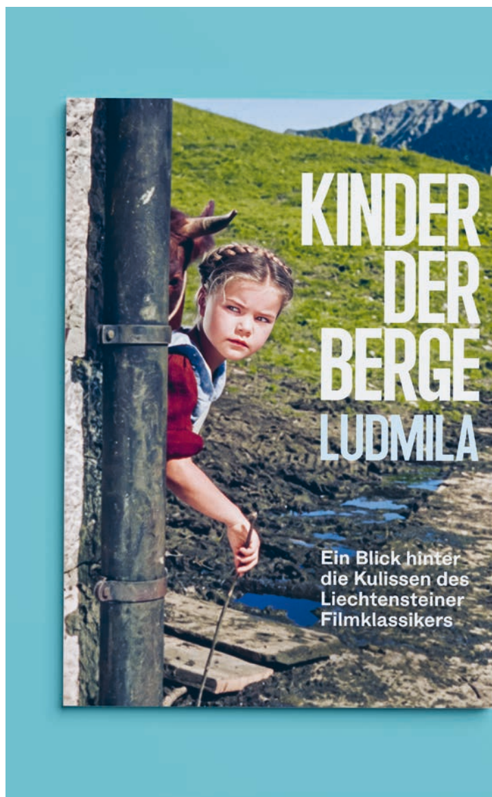
Broschüre zum Film «Kinder der Berge»: Damit wird der Vermittlungsauftrag der Nationalbibliothek in beispielhafter Weise sichtbar gemacht.