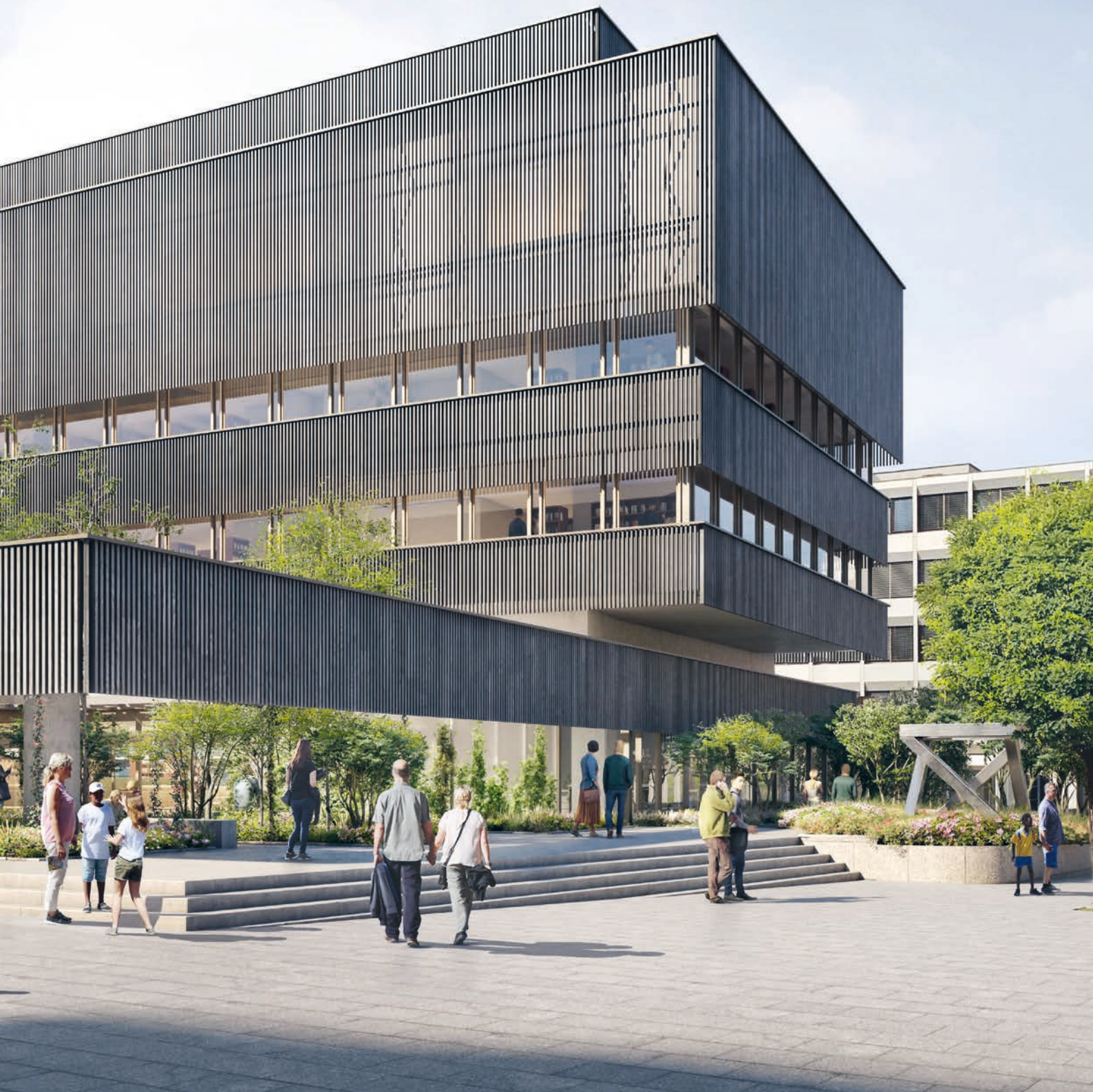
Projekt «Neue Liechtensteinische Landesbibliothek» beim ehemaligen Post- und Verwaltungsgebäude Vaduz