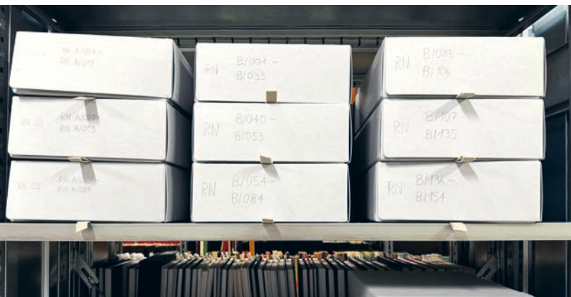
Archivdossiers des Nachlasses von Rainer Nägele im Magazin Schaanwald.

Das Liechtensteinische Literaturarchiv ist eines der jüngsten Projekte der Landesbibliothek und verfolgt den Zweck, bedeutende literarische Bestände mit Bezug zu Liechtenstein langfristig zu sichern. Dazu gehören vor allem Unterlagen von liechtensteinischen Autorinnen und Autoren oder von Personen, die im Land literarisch tätig waren. Diese Materialien werden in Archivdossiers abgelegt und sind via den Bibliothekskatalog NetBiblio abrufbar.