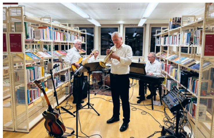
Musikalische Unterhaltung durch das Quartetts «JazzTime» an der ORF-Langen Nacht der Museen