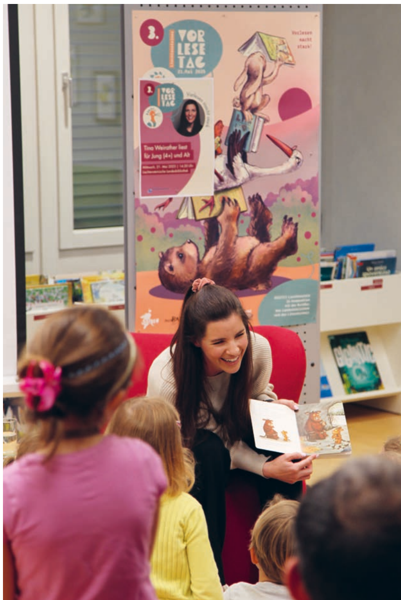
Vorlesetag mit Tina Weirather mit 40 Kindern in der Landesbibliothek.