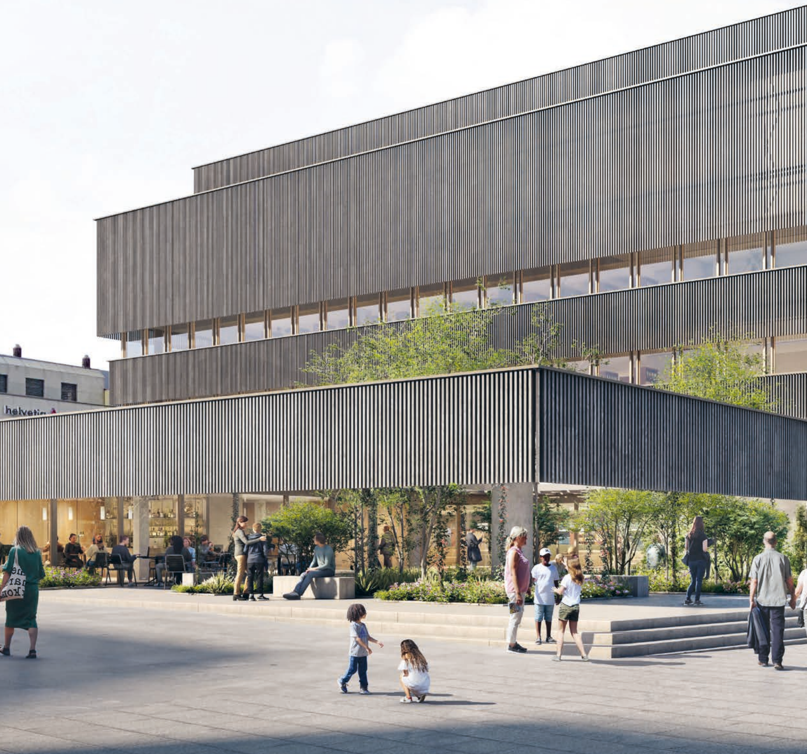
Als Zentrum für das lebenslange Lernen wird die «Neue Liechtensteinische Landesbibliothek» mit einem Bibliotheks-Café, Veranstaltungsraum und begrünten Aussenbereichen zu einem lebendigen Treffpunkt von Vaduz werden.